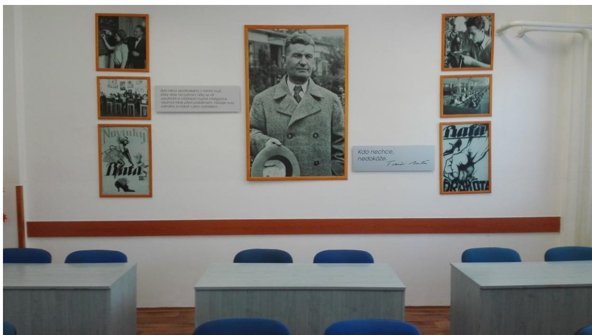
Výzdoba třídy, která je věnována Tomáši Baťovi