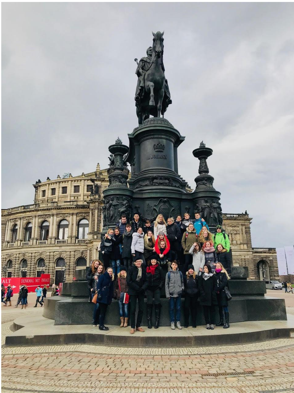
Vzdělávací exkurze do Drážďan