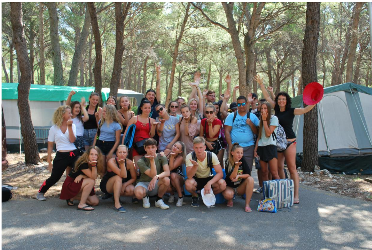
Sportovně turistický kurz v Chorvatsku